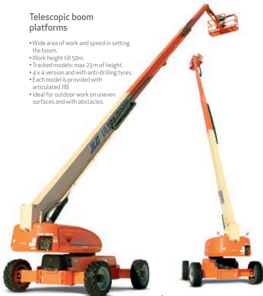
PIATTAFORME TELESOPICHE TELESCOPIC BOOM PLATFORMS