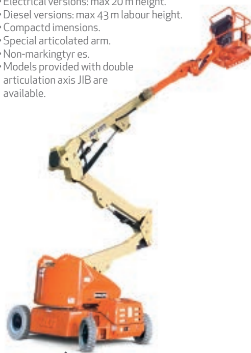
PIATTAFORME ARTICOLATE ARTICULATED BOOM PLATFORMS